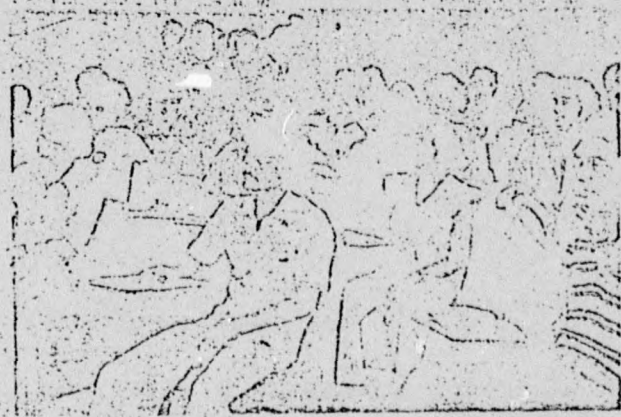
Estudantes foram ao encontro com uma série de reivindicações

Como primeiro ponto da pauta da assembleia ficou a desativação da Assessoria de Segurança e Informação (ASI), sistema de avaliação, eleições diretas para o DCE e colegiados superiores e a resolução nº 2. Ainda esta semana, os estudantes se reunirão com o pró-reitor para indicar os nomes que integrarão sua assessoria técnica.