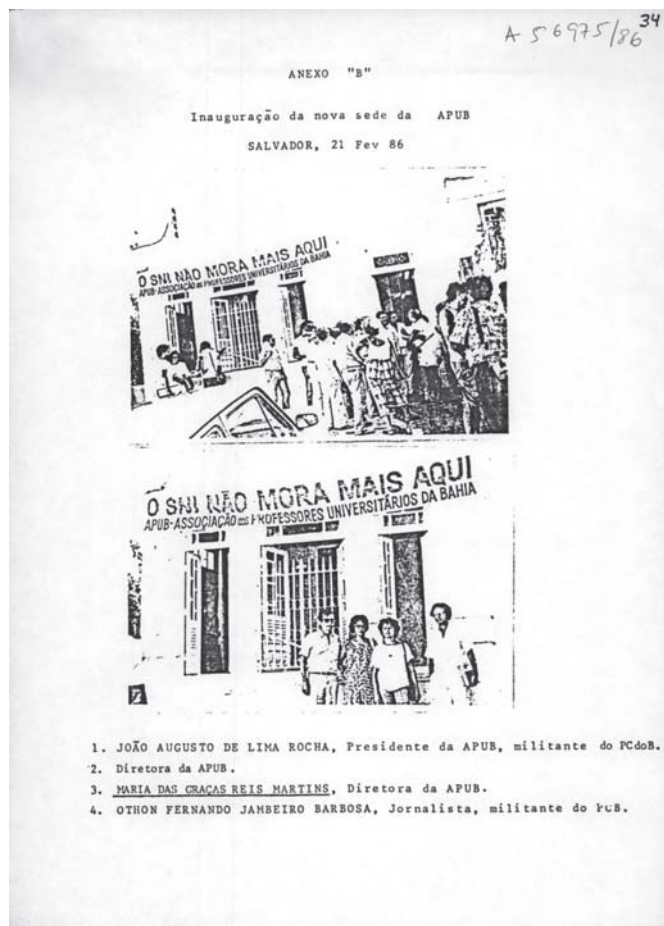
Professores da UFBA na inauguração da nova sede da Associação dos Professores Universitários da Bahia. Salvador, 1986.

desativada a partir de janeiro de 1980. Mas aduziu: “O ato não implica na extinção do órgão”. Como interpretar essa informação paradoxal: órgão desativado, mas não extinto? Talvez essa fala revele alguma discordância em relação às determinações superiores, e o desejo de que as coisas voltassem ao estado anterior, ou, simplesmente, seja indício de que o trabalho de informações continuaria como antes, embora no âmbito da delegacia do MEC. De qualquer modo, o diretor da DSI solicitou a