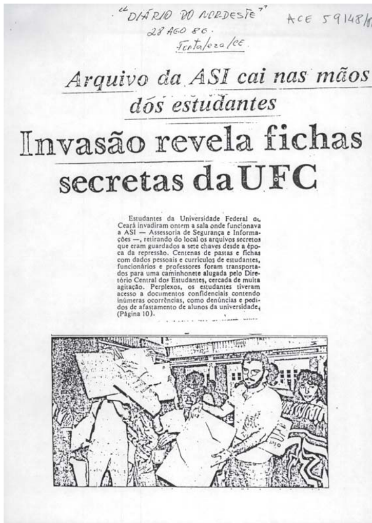
Estudantes da Universidade Federal do Ceará com as pastas do arquivo da ASI da Universidade, Fortaleza, 1986.

Outros casos de vazamento de documentos sigilosos das ASI universitárias ocorreram nos meses seguintes, como na Universidade Federal Rural de Pernambuco (UFRPE), em julho de 1981, e na Universidade Federal de Santa Maria (UFSM), em agosto de 1982. Não é necessário entrar em detalhes, mas vale a pena mencionar as atitudes contrastantes dos respectivos reitores. No primeiro caso, na UFRPE, o reitor contribuiu para a pu-