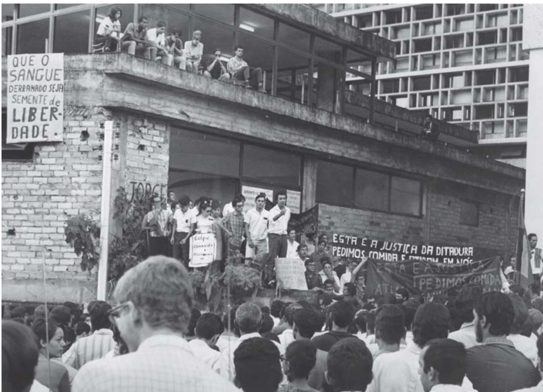
Manifestação de estudantes em frente à Faculdade de Direito da UFMG. Belo Horizonte, 1986.